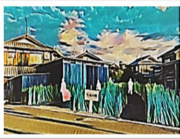
「カバタ」の水で冷えた果物や飲み物の販売を行う。休憩所、住民の窓口となる。

■わたしはこの要項を読んだとき、まさきに故郷である針江の「カバタ」が頭に浮かびました。わたしは現在寮に住んでおり地元を離れています。離れて気付いた針江の自然の美しさ、人々の暖かさがありました。地域住民はカバタを通して人と人が、また自然と人が繋がってきたのです。つまり針江地域におけるカバタとは、手入れしながら使用する仕組みにより発酵してきた、地域の生活に深く根付いた文化であるといえます。