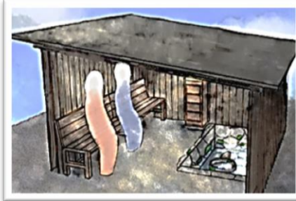
閉鎖的な空間で光を浴びる「カバタ」を眺める。