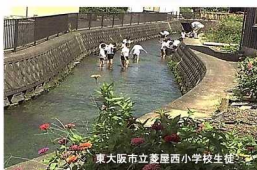
東大阪市立夢屋西小中学校生

酸業一杯の湧き水がもたらすカバタパワーが様々な琵琶湖の生態系に良い環境を与えています。日常茶飯事の生活の中で守り継がれた水文化を伝えましょう。