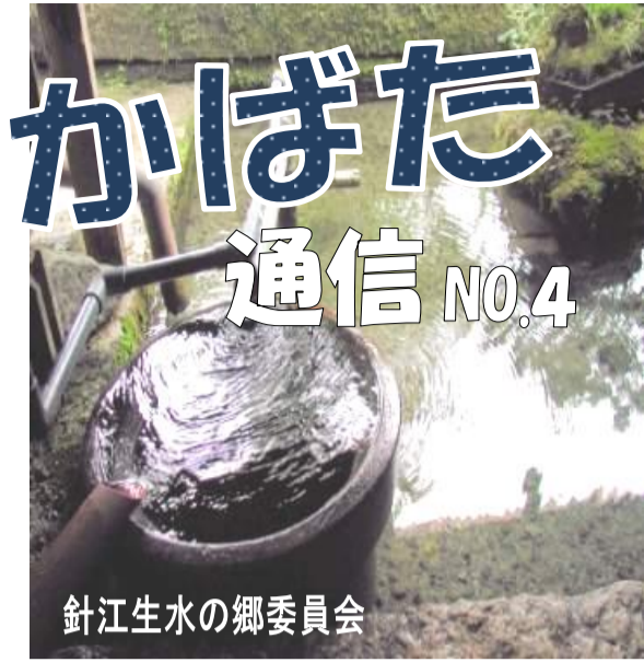
針江生水の郷委員会

地球は水で出来ています。永遠に青く輝く星であるために...めぐり巡って来る、清い生水を守り続けたい。